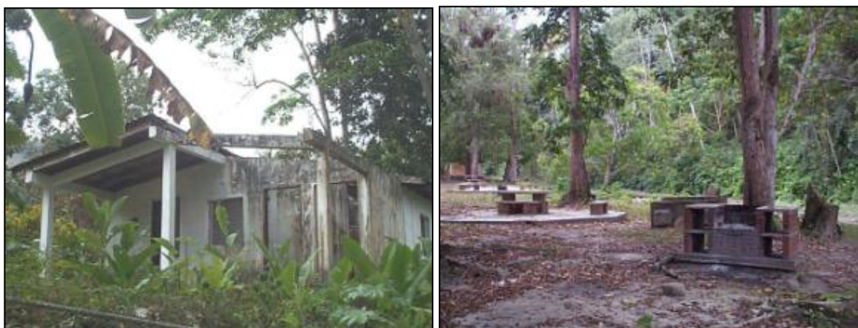
Area Recreacional Guayabita. La estación de guardaparques y las facilidades para los visitantes fueron abandonadas en 1999. El acceso es ahora prohibido

La mayoría de los visitantes de Yurubí son personas residentes de San Felipe. Las visitas están concentradas en las dos áreas de recreación. La primera es el área de recreación Leonor Bernabó. Esta tiene una piscina y es un área de recreación usada también para actividades educativas. Los usuarios pagan una tarifa de 1.000 Bolívares (aproximadamente US $ 1.35, Setiembre 2001) por persona. Hay aproximadamente 300 visitantes cada fin de semana. La segunda área de recreación es Guayabita, que ha sido completamente abandonada. Desde Diciembre de 1999, esta no ha recibido mantenimiento. ParksWatch - Venezuela visitó el área en Abril del 2001 y confirmó que tiene un excelente potencial de recreación y educativo, pero la infraestructura necesita ser mejorada.