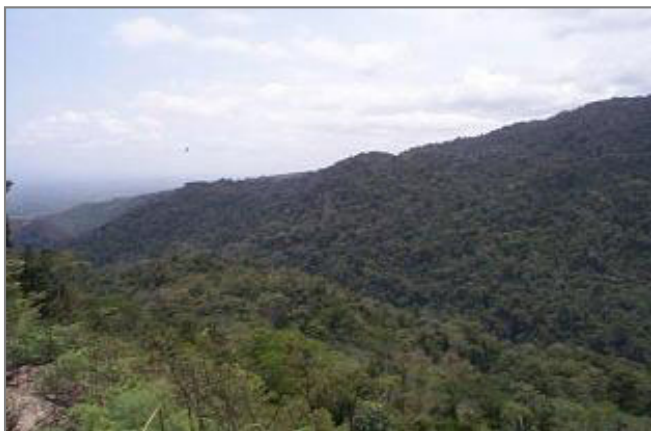
Arriba: Parque Nacional Yurubí, Venezuela Limite occidental, vista hacia el norte

El Parque Nacional Yurubí es uno de los parques nacionales mejor preservados del sistema nacional de parques de Venezuela. El programa de reubicación de las comunidades llevado a cabo por INPARQUES 16 años atrás ha contribuido a la conservación del parque. Sin embargo, el parque está siendo amenazado por muchos problemas tales como cacería ilegal, incendios, y colonización humana. Una infraestructura apropiada y un apoyo económico adecuado ayudaría a eliminar la mayoría de estas amenazas. Para poder asegurar el futuro del Parque Nacional Yurubí, un objetivo a largo plazo deberá ser el fortalecimiento de las relaciones de las comunidades adyacentes con el parque. Las futuras amenazas del parque se podrán evitar tan solo cuando las personas reconozcan el verdadero valor del parque.