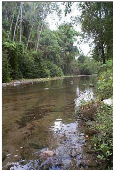
Foto a la derecha: Arroyo que corre a lo largo del área de recreación abandonada Los Guayabitos