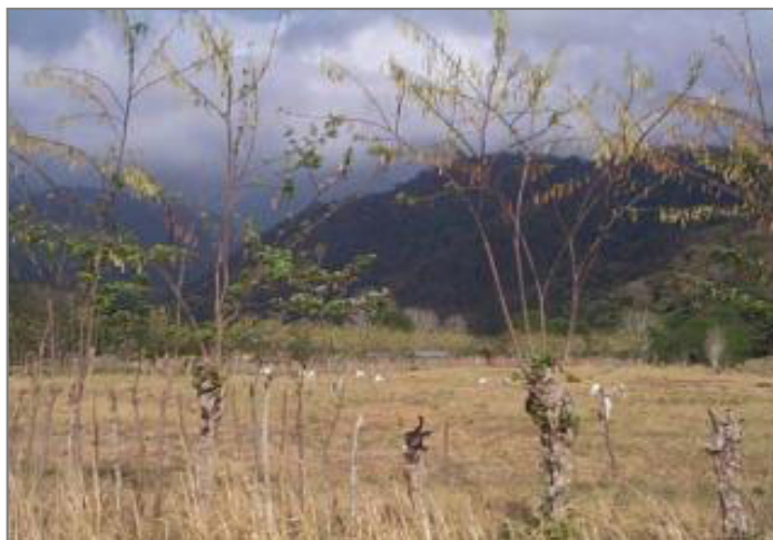
Potreros en los alrededores de los límites del Parque Nacional Yurubí

Actualmente no se encuentran poblaciones humanas dentro de los límites del parque. Los pobladores anteriores, la mayoría agricultores de pequeña escala, fueron reubicados en 1985. El Estado procedió a comprar sus propiedades y les concedió otros terrenos en las afueras del parque. Existen numerosas poblaciones a lo largo de los límites del parque, pero aparentemente existe un bajo riesgo de colonización debido a numerosos factores. En la vertiente norte la carretera principal está 60 km lejos del parque y el área comprendida entre la carretera y el límite casi no tiene habitantes. Las áreas en el sur del parque están sujetas a posibles invasiones humanas ya que se encuentran muy próximas a las ciudades de San Felipe, Marín y Albarico. En esta área se encuentran numerosas haciendas de ganado y agricultura, localizadas entre la carretera y el parque. En el área también hay una escuela de agricultura. Afortunadamente, por el momento, los agricultores y ganaderos no parecen estar interesados en el bosque empinado que se encuentra adyacente a sus propiedades, pero los fuegos ocasionales producidos por los pobladores en sus territorios podrían representar una amenaza potencial al parque.