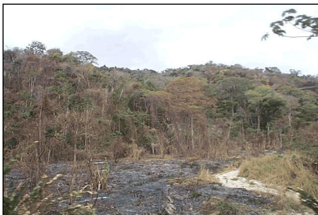
Área después de haber sufrido un incendio que sucedió a lo largo de la carretera a Aroa.