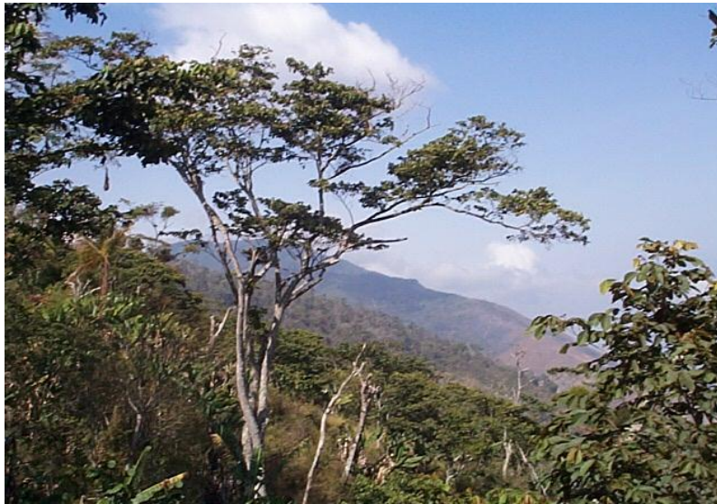
Vista del Parque Nacional Yurubí